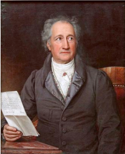
Johann Wolfgang von Goethe um 1828

Um 1770 entsteht in Deutschland mit dem „Sturm und Drang“ eine Bewegung junger Schriftsteller, die sich als Gegenpol zur vernunft- und verstandesbetonten Aufklärung versteht. Diese neuen Literaten stellen das Gefühl und die grenzenlose Selbstentfaltung des Einzelnen in den Mittelpunkt. Die wichtigsten Vertreter dieser kurz dauernden Bewegung sind Johann Wolfgang Goethe und Friedrich Schiller. Mit ihren frühen Dramen wie Goethes „Götz von Berlichingen“ und Schillers „Die Räuber“ und „Kabale und Liebe“ protestierten sie leidenschaftlich gegen die herrschende Ordnung. Goethes Briefroman „Die Leiden des jungen Werther“ wird als Spiegelbild für das Lebensgefühl der jungen Generation zu einem Kultbuch für die damaligen Intellektuellen.