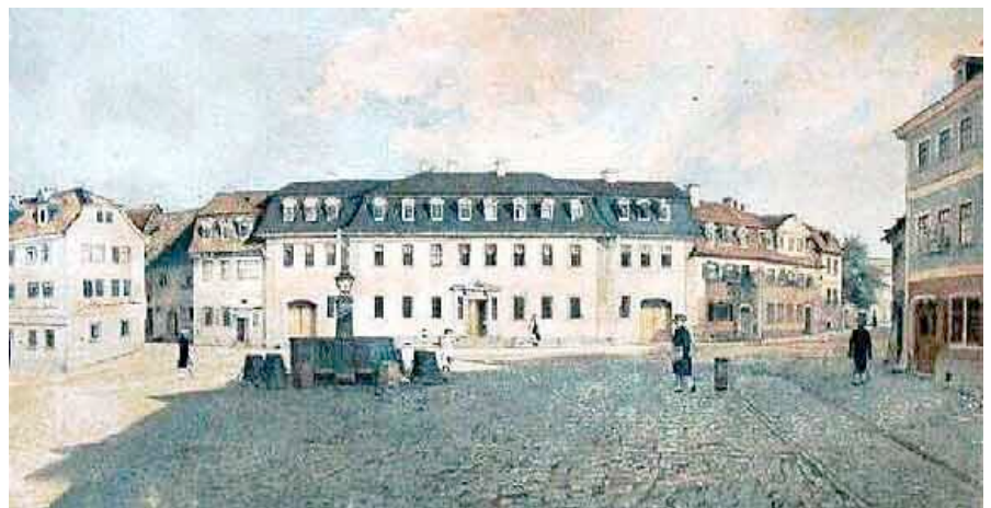
Am Frauenplan. Goethes späterer Wohnsitz in Weimar.

Die amtliche Tätigkeit war mit der Vernachlässigung seiner schöpferischen Fähigkeiten verbunden. Das löste nach dem ersten Weimarer Jahrzehnt eine persönliche Krise aus, der sich Goethe durch die Flucht nach Italien entzog. Die zweijährige Italienreise empfand er wie eine „Wiedergeburt“. Ihr verdankte er die Vollendung wichtiger Werke wie z.B. „Iphigenie auf Tauris“. Die italienische Landschaft, Baukunst und Literatur beeindruckten ihn tief . Italiens