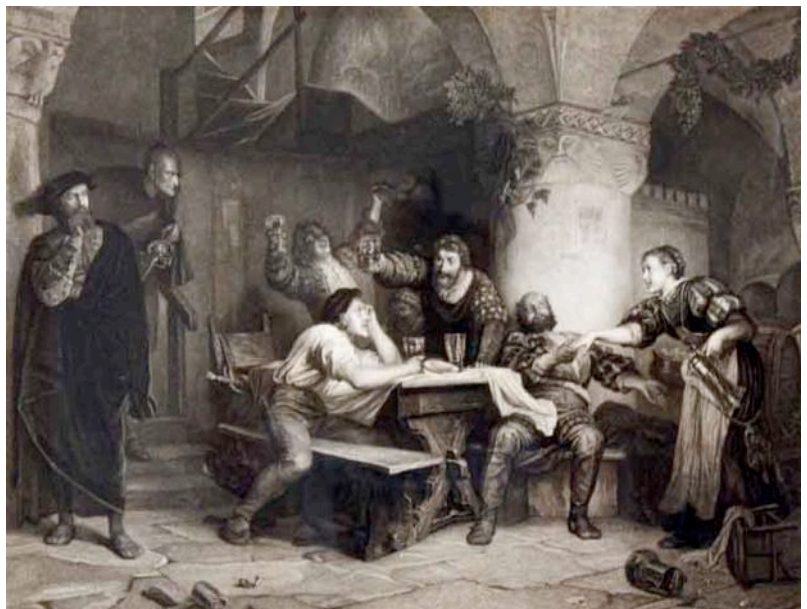
In Auerbachs Keller, Leipzig. (Szene aus dem „Faust“)

Der junge Goethe lernte auch Klavier spielen, fechten und reiten. Mit 16 Jahren zog er nach Leipzig, um, dem Wunsch seines Vaters folgend, Rechtswissenschaft zu studieren. Eigentlich hätte er lieber in Göttingen alte Sprachen, Geschichte und Literatur studiert. Öfters als in rechtswissenschaftlichen Vorlesungen zu sitzen, genoss er dann das Studentenleben: „Mein Leipzig lob ich mir! Es ist ein Klein-Paris und bildet seine Leute“ wird später in seinem Werk „Faust“ zu lesen sein. In Leipzig stieß der junge Goethe auf die Motive für den Faust-Stoff. Er setzte mit seiner Dichtung auch dem „Auerbachs Keller“ - einer Lokalität, in der er gern zechte - ein Denkmal.