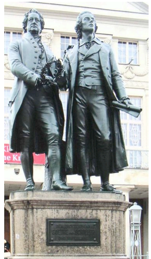
Goethe und Schiller, Denkmal in Weimar

Goethe wurde immer berühmter . Menschen aus vielen Ländern pilgerten nach Weimar, um ihm ihre Verehrung zu zollen. Goethe zog sich mehr und mehr aus der Öffentlichkeit zurück. Er baute sich seine eigene Welt der Schönheit und der idealen Formen auf und beschäftigte sich mit Naturforschungen.