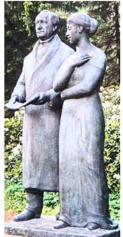
Goethe-Denkmal in Marienbad (heute Tschechien)

Auch noch im Alter ergriff Goethe immer wieder die Leidenschaft für schöne und geistvolle Frauen . Aus seiner Beziehung zu Marianne von Willemer entstand der „West-Östliche Diwan“, als Zweiundsiebzjähriger verliebte er sich bei einem Kuraufenthalt in Marienbad in die neunzehnjährige Ulrike von Levetzow - den Schmerz über die Abweisung des Heiratsantrags drückte Goethe in seiner „ Marienbader Elegie “ aus, mit deren Niederschrift er im September 1823 auf seiner Abreise aus Marienbad in der Kutsche begann. Bis ins höchste Alter – er starb 1832 im Alter von fast 83 Jahren – war Goethe von einer erstaunlichen Schaffenskraft . Seine Lebenserinnerungen schrieb er auf in seinem Werk „ Dichtung und Wahrheit “.