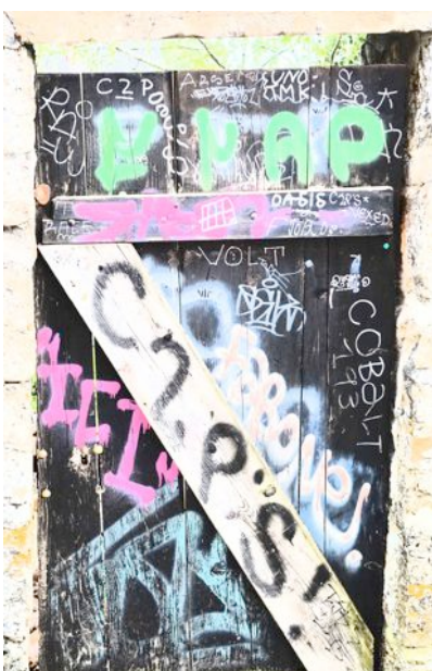
Tag heißt die „Unterschrift“ eines Sprayers, womit er - ähnlich wie ein Hund - sein Revier kennzeichnet.