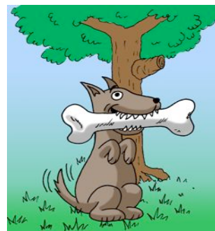
der Knochen des Hundes