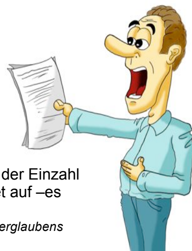
der Inhalt der Rede