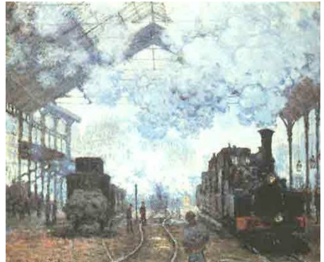
CLAUDE MONET: „GARE SAINT LAZARE“ 1877

Als 1804 die Dampflokomotive erfunden wurde, entstand im Laufe der Zeit ein Netz von Zugverbindungen.