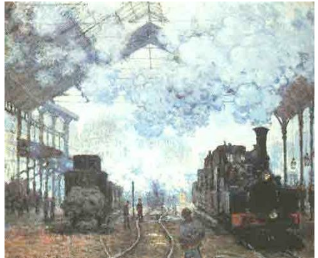
CLAUDE MONET: „GARE SAINT LAZARE“ 1877

Als 1804 die Dampflokomotive erfunden wurde, entstand im Laufe der Zeit ein Netz von Zugverbindungen.