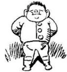
Peter Sutit, frech und dick, hat natürlich auch kein Glück