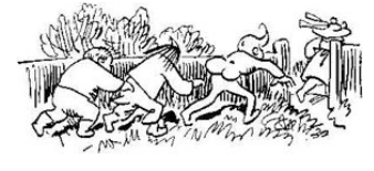
Kränkend ist ein solches Wort. Julchen eilt geschwinde fort.

Böse Knaben gibt's noch viele, zeichne zwei nach deinem Stile!