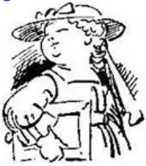
Und mit teilnahmevollem Sinn schaut sie gern nach Knaben hin.