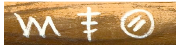
Bissiger Hund - Hier wohnt Polente - Man ruft die Bullen

Bis zur Französischen Revolution war die europäische Gesellschaft in Stände gegliedert: Adel, Geistliche, Bürger, Bauern und erste Fabrikarbeiter. Daneben gab es noch eine nicht-sesshafte Bevölkerungsgruppe, die ständig mit Repressionen zu rechnen hatte . Dieser „standlose Stand“ zahlte keine Steuern und wurde von der bürgerlichen Gesellschaft, die sich seit dem 18. Jahrhundert entwickelte, stets misstrauisch beobachtet. Als Vaganten (ursprünglich die Bezeichnung für Studenten unterwegs) galten neben flüchtigen Verbrechern auch Fahrende und Landstreicher, die als Bettler, Hausierer, Kesselflicker oder mit kleinen Gauernerien ihren Lebensunterhalt bestreiten mussten.