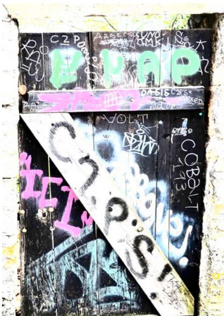
Tag heißt die „Unterschrift“ eines Sprayers, womit er - ähnlich wie ein Hund - sein Revier kennzeichnet.

Irgendwie haben heutzutage die an Türen und Mauern gesprühte „Tags“ eine ähnliche Funktion wie früher die Familienwappen.