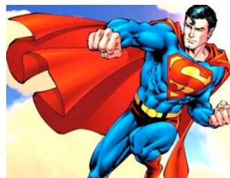
Superman zu Zeiten von Donald Trump

anzupassen. Letztlich ist allerdings alle Mühe umsonst, denn wegen seiner Quasi-Unbesiegbareit befindet er sich, so Eco, «in der bedenklichen narrativen Situation, ein Held ohne Gegner und damit ohne Entwicklungsmöglichkeiten zu sein». Um die Figur von Superman wurde schon lange keine relevante Geschichte mehr erzählt, und schon lange hat er dem Genre keine Impulse mehr geben können. Superman ist ein Logo, und das schränkt seinen psychologischen und erzählerischen Spielraum ein – ganz im Gegensatz zu Batman und gewissen Heroen der sechziger Jahre wie Spiderman oder die X-Men, die zwar weniger Symbolkraft haben, aber interessantere und entwicklungsfähige Figuren abgeben.