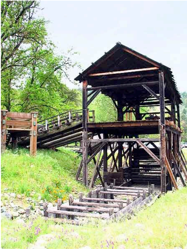
Sutters Sägemühle in Coloma (Rekonstruktion)

zurückgekehrt, steht zitternd vor Aufregung vor ihm, drängt ihn in sein Zimmer, schließt die Tür ab und zieht aus der Tasche eine Handvoll Sand mit ein paar gelben Körnern darin. Gestern, beim Graben sei ihm dieses sonderbare Metall aufgefallen, er glaube, es sei Gold, aber die anderen hätten ihn ausgelacht. Sutter wird ernst, nimmt die Körner, macht die Scheideprobe: es ist Gold. Er entschließt sich, sofort am nächsten Tage mit Marshall zur Farm hinaufzureiten, aber der Zimmermeister ist als erster von dem furchtbaren Fieber ergriffen, das bald die Welt durchschütteln wird: noch in der Nacht, mitten im Sturm, reitet er zurück, ungeduldig nach Gewissheit.