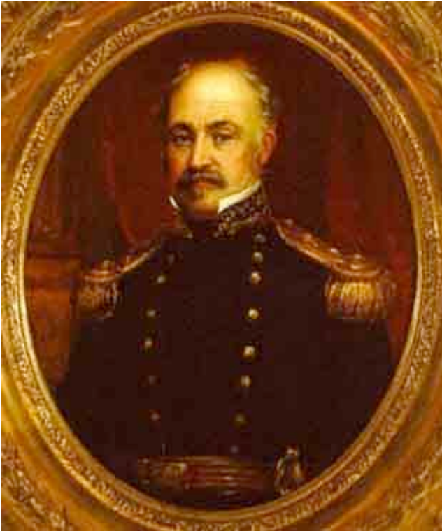
John A. Sutter um 1860

damit für die Ungeduldigen drei bis vier Wochen erspart würden und sie früher zum Gold gelangen. Quer über den Kontinent ziehen riesige Karawanen, Menschen aller Rassen und Sprachen, und alle wühlen sie in Johann August Sutters Eigentum wie auf eigenem Grunde. Auf der Erde