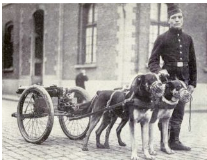
Belgischer Mitrailleur 1914

Aber die schlimmen Nachrichten häuften sich und wurden immer bedrohlicher. Erst das Ultimatum Österreichs an Serbien, die ausweichende Antwort darauf, Telegramme zwischen den Monarchen und schließlich die kaum mehr verborgenen Mobilisationen. Es hielt mich nicht mehr länger in dem engen, abgelegenen Ort. Ich fuhr jeden Tag mit der kleinen elektrischen Bahn nach Ostende hinüber, um den Nachrichten näher zu sein; und sie wurden immer schlimmer. Noch badeten die Leute, noch waren die Hotels voll, noch drängten sich auf der Digue promenierende, lachende, schwatzende Sommergäste. Aber zum ersten Mal schob sich etwas Neues dazwischen. Plötzlich sah man belgische Soldaten auftauchen, die sonst nie den Strand betraten. Maschinengewehre wurden – eine sonderbare Eigenheit der belgischen Armee – von Hunden auf kleinen Wagen gezogen.