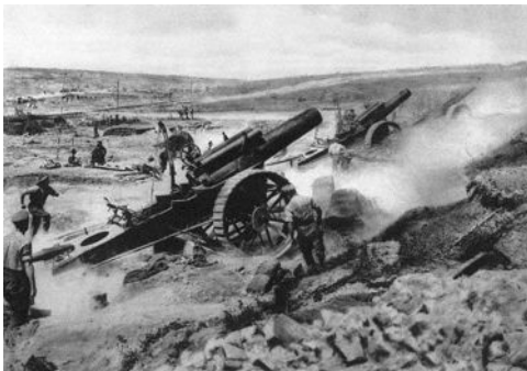
Deutsche Artillerie beschießt ein belgisches Fort im August 1914

Aber auf dem halben Wege nach Herbesthal, der ersten deutschen Station, blieb plötzlich der Zug auf freiem Felde stehen. Wir drängten in den Gängen zu den Fenstern.