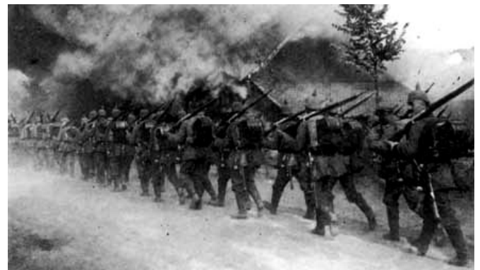
Deutsche Infanterie auf dem Vormarsch durch Belgien im August 1914