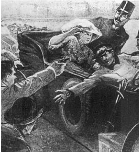
Das Attentat von Sarajewo vom 28. Juli 1914

Erbitterung war von den Gesichtern abzulesen. Denn der Thronfolger war keineswegs beliebt gewesen. Noch von meiner frühesten Kindheit erinnere ich mich an jenen andern Tag, als Kronprinz Rudolf, der einzige Sohn des Kaisers, in Mayerling erschossen aufgefunden wurde. Damals war die ganze Stadt in