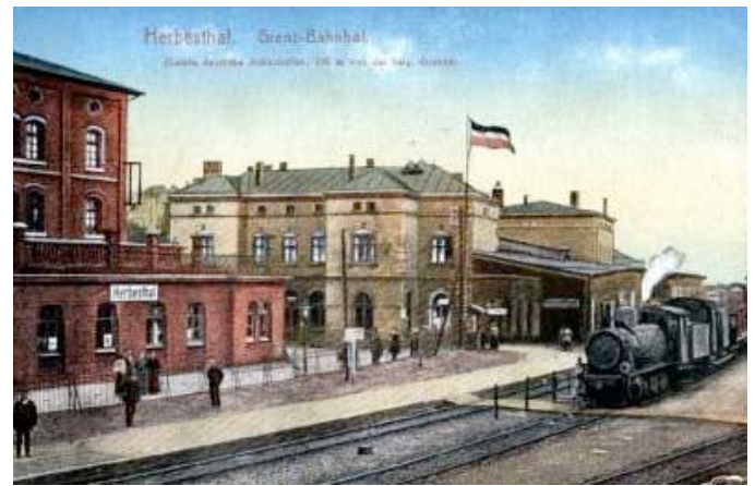
Der Grenzort Herbesthal um 1914

Was war geschehen? Und da sah ich im Dunklen einen Lastzug nach dem andern uns entgegenkommen, offene Waggons, mit Plachen bedeckt, unter denen ich undeutlich die drohenden Formen von Kanonen zu erkennen glaubte. Mir stockte das Herz. Das musste der Vormarsch der deutschen Armee sein. Aber vielleicht, tröstete ich mich, war es doch nur eine Schutzmaßnahme, nur eine Drohung mit Mobilisation und nicht die Mobilisation selbst. Immer wird ja in den Stunden der Gefahr der Wille, noch einmal zu hoffen, riesengroß. Endlich kam das Signal ›Strecke frei‹ der Zug rollte weiter und lief in der Station Herbesthal ein. Ich sprang mit einem Ruck die Stufen hinunter, eine Zeitung zu holen und Erkundigungen einzuziehen. Aber der Bahnhof war besetzt von Militär. Als ich in den Wartesaal eintreten wollte, stand vor der verschlossenen Tür abwehrend ein Beamter, weißbärtig und streng: niemand dürfe die Bahnhofsräume betreten. Aber ich hatte schon hinter den sorgfältig verhängten Glasscheiben der Tür das leise Klirren und Klinkern von Säbeln, das harte Niederstellen von Kolben gehört. Kein Zweifel, das Ungeheuerliche war im Gang, der deutsche Einbruch in Belgien wider aller Satzung des Völkerrechts. Schauernd stieg ich wieder in den Zug und fuhr weiter, nach Österreich zurück. Jetzt gab es keinen Zweifel mehr: ich fuhr in den Krieg.